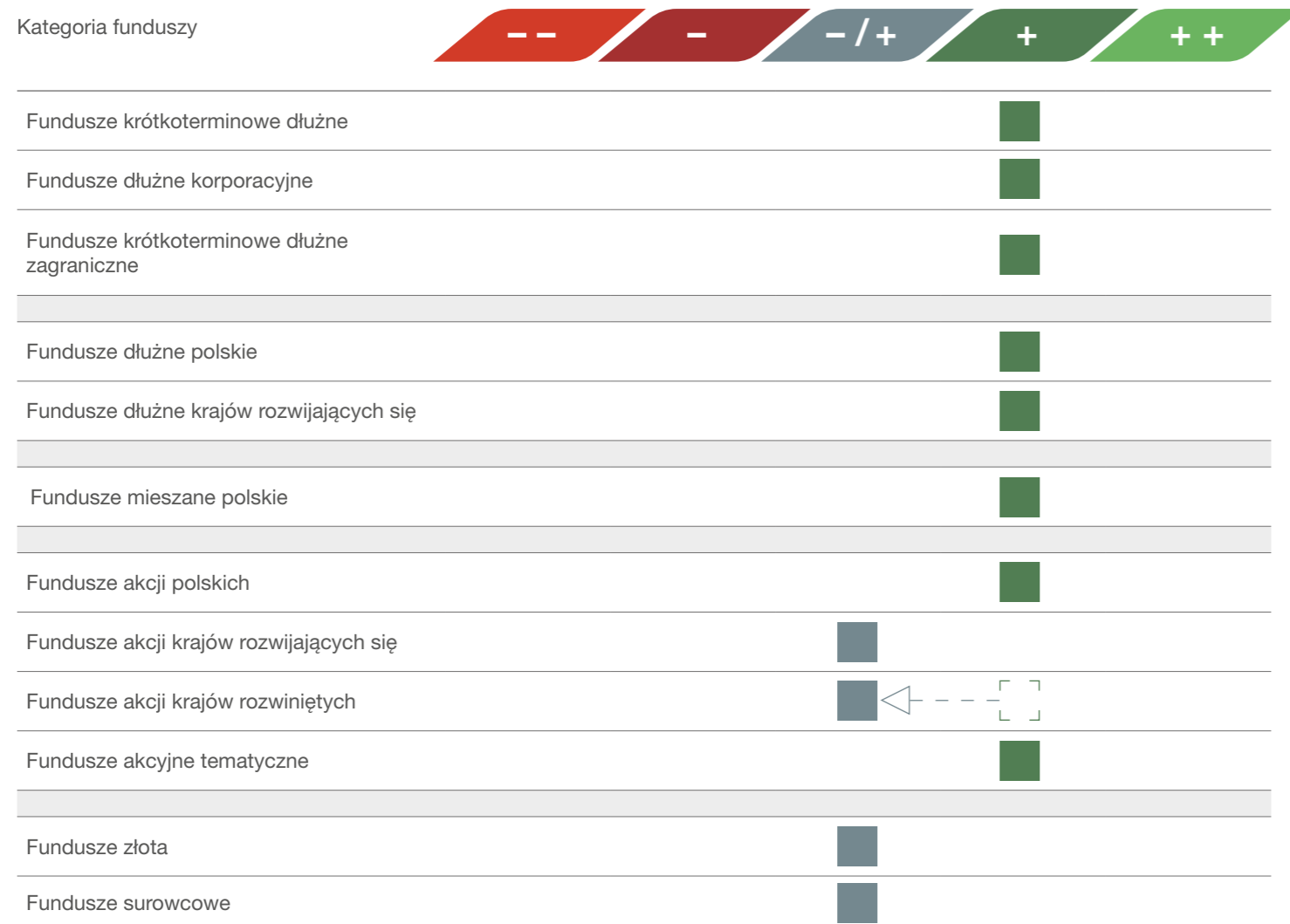
Wpływ otoczenia gospodarczego na daną kategorię funduszy

– ➤ Zmiana nastawienia w odniesieniu do poprzedniej publikacji.